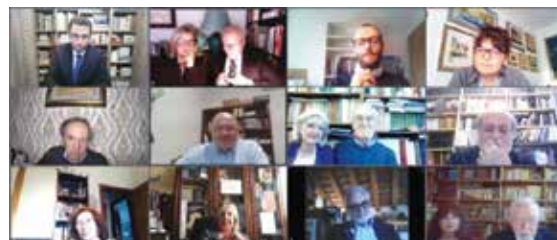
Ospiti della cerimonia di premiazione.

La cerimonia di premiazione è visibile al link seguente: https://www.youtube.com/watch?v=wPntNC2sayE